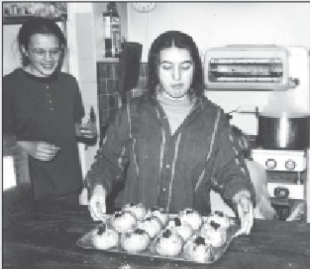
Los estudiantes participan activamente en las actividades diarias de cocina y limpieza y frecuentemente organizan el servicio de bebidas y comidas para grandes grupos. .

ésta escuela se encuentra situada en una zona rural pobre. Aproximadamente, el 35 % de los fondos proviene de la matrícula que pagan aquellos padres que cuentan con los recursos para hacerlo. El otro 40% proviene de fundaciones privadas que dan donaciones individuales a la escuela y el otro 25% se recolecta a través de eventos especiales organizados por los padres estudiantes. Ellos organizan cenas especiales en la escuela, así como también ferias navideñas y de pascua en el pueblo. Ellos proveen el servicio de comidas y bebidas en grandes eventos tales como las conferencias en el Schumacher College o en reuniones generales anuales de varias organizaciones. El mantenimiento de la escuela lo asisten varios padres voluntarios. The Small School no sigue