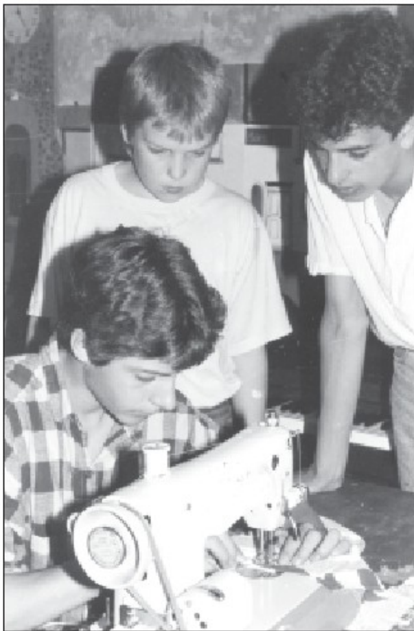
Arriba: práctica semanal de escalada, al menos una tarde a la semana se dedica a actividades físicas. Abajo: Durante la semana de la ropa, todos los estudiantes deben fabricar una pieza de ropa.

En The Small School, nuestros niños aprenden estas habilidades prácticas y manuales. Muchas de las ideas que implementamos las aprendimos de Mahatma Gandhi, quien inició el movimiento en la India para una educación básica en la que se introdujera, como parte del currículum, los aspectos relacionados con la limpieza, la cocina y la jardinería. También, nos preocupaba que la tendencia principal, para ese entonces, se enfocara, casi en su totalidad, en un aprendizaje en el salón de clases, lo que hacía difícil aprender acerca del mundo natural. Para nosotros no sólo era importante que nuestros niños aprendieran acerca de, sino también con la naturaleza. Generalmente, la educación tiende a ser antropocéntrica; nos enseñan acerca de la naturaleza únicamente para manipularla o controlarla asumiendo que la naturaleza está ahí afuera a nuestra disposición. Nos parece que la naturaleza debe ser un maestro tan importante como el maestro de un salón de clases. Así que decidimos que, al menos una vez a la semana, nuestras clases se llevarían a cabo al aire libre.