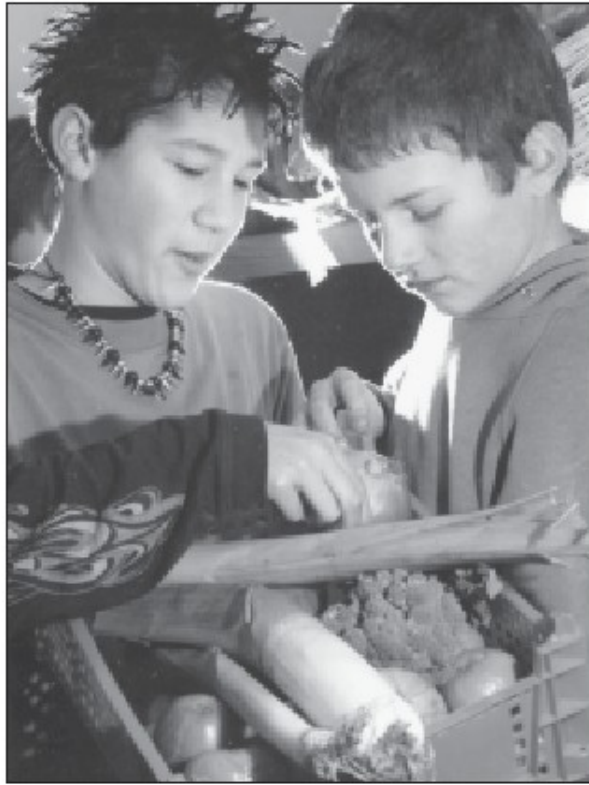
La preparación diaria del almuerzo comienza con una visita a la tienda de víveres del pueblo.

Nuestros niños no tienen dificultades para ingresar a la universidad,- ellos pueden enfrentar un examen tan bien como otros estudiantes. Mi hija obtuvo el título en filosofía, en la University of New Durham, al norte de Inglaterra, y cuando se graduó trabajó y ahorró dinero para viajar a la India durante 18 meses por su propia cuenta.