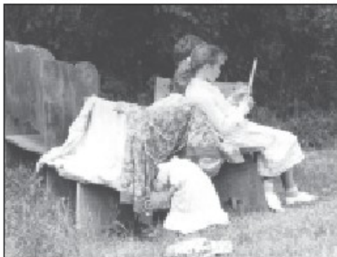
Tiempo libre en el jardín después del almuerzo.

En The Small School tratamos de descubrir el don único de cada niño para luego ayudarlo a que lo desarrolle. En lugar de decir “tú no eres bueno para esto y, por lo tanto, no sirves”, nosotros decimos “tú eres bueno en algo, trata de desarrollarlo”. Es una educación que va de adentro hacia fuera, en lugar de afuera hacia adentro. Es “educatis” desarrollar lo que uno lleva por dentro, como el roble sale de la bellota.