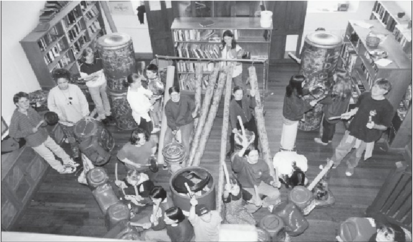
Evento popular durante la semana de la Música que consiste en tocar instrumentos hechos con desechos de equipo agrícola.