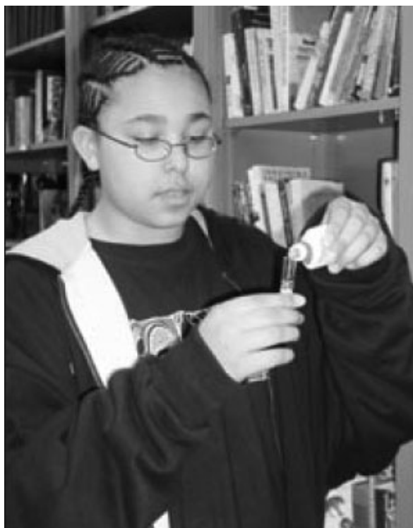
Testeando el pH del agua.

Leer cuentos infantiles que versen sobre peces y hacer que los estudiantes escriban sus propias historias basadas en sus observaciones de la