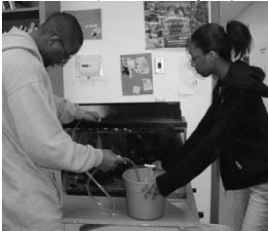
El mantenimiento de una pecera incluye el recambio del 20% del agua cada dos semanas

Hay un gran número de especies de peces tropicales de agua dulce, y muchas variedades de formas y colores dentro de cada especie. La mejor opción para un acuario en el aula son peces comunitarios pacíficos como los tetra, los gurami, los danio zebra, los madrecita de agua y los rasbora. Las necesidades de estas comunidades de peces son lo suficientemente similares como para que varias especies puedan vivir conjuntamente. Por otro lado, peces semi-agresivos o agresivos son más difíciles de mantener y limitan enormemente la diversidad de especies que pueden habitar la misma pecera. (Los sitios web listados al final de este artículo ofrecen información detallada sobre los requerimientos de las distintas especies de peces, incluyendo tipo de iluminación, química del agua y combinaciones más recomendables de convivencia).