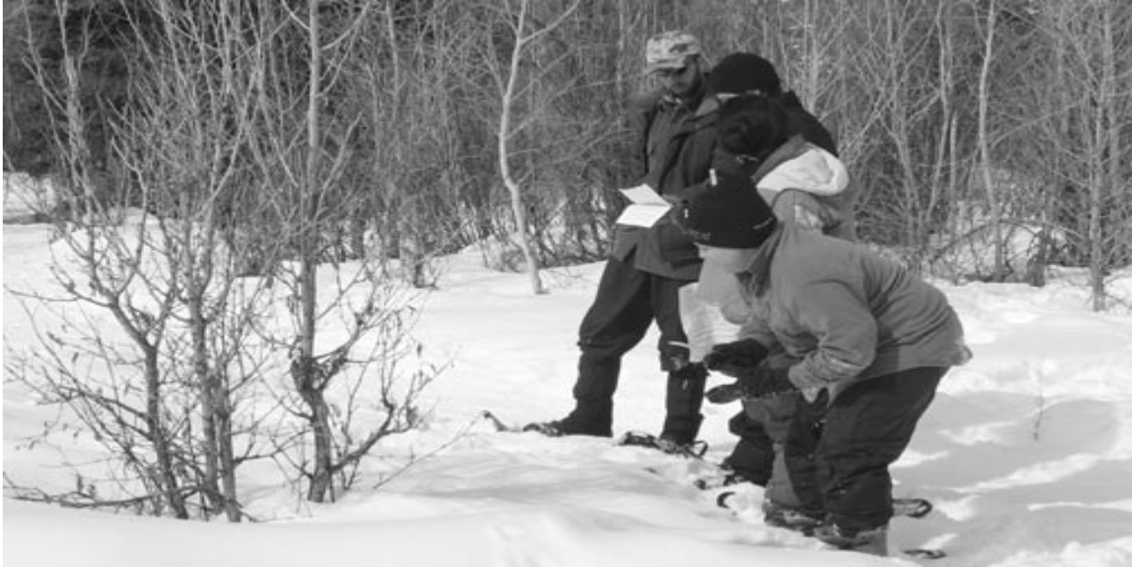
Les élèves cherchent des traces d'animaux ainsi que d'autres caractéristiques naturelles qui améliorent la valeur de la terre.

La qualité de l'eau et l'analyse des droits relatifs à l'eau : des bassins hydrologiques salubres attireront les visiteurs au parc pour la navigation et la pêche sportive. Donc, l'eau qui a un degré de pH situé dans la catégorie neutre (6 à 8) aura une valeur économique plus élevée que celle qui est plus élémentaire ou acide. Outre le test de pH, les élèves peuvent aussi évaluer des caractéristiques telles que la turbidité, la couleur et l'odeur. Encore une fois, on peut attribuer des montants pour chaque paramètre testé. La valeur des droits de l'eau est égale à ce qu'il pourrait en coûter pour avoir de l'eau transportée par camion d'une source extérieure s'il n'en existait aucune sur le site.